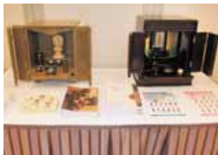
展示協賛：お仏壇のはせがわ