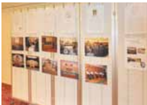
葬儀展示コーナー