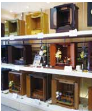
▲マンションにも設置しやすい小型の家具調タイプも人気です