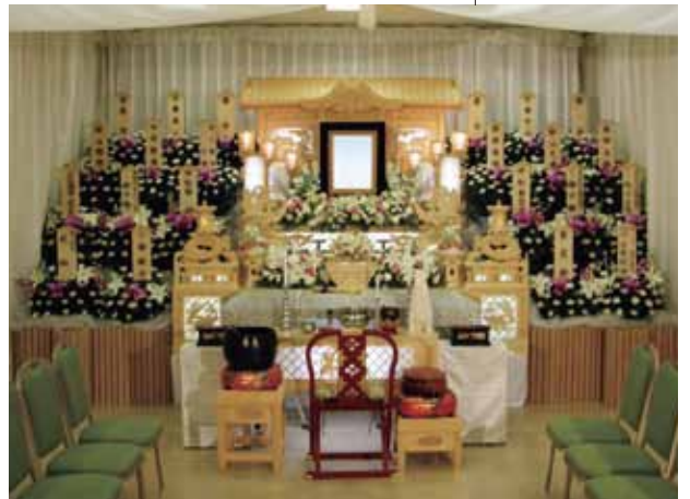
一般葬 都内火葬場併設斎場使用の場合

故人とゆかりのある方々が、葬儀後から自宅にご訪問されるようなケースがあり、かえってご負担や疲労がかさむ場合もあります。